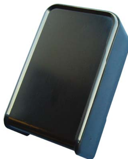
Le détecteur de graffiti Merlin: MGD-S